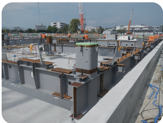
横須賀市新市立病院建設工事