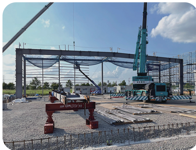
埼玉キッコーマン 工場併設倉庫新設工事