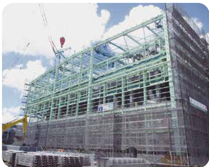
竹本油脂(株)鹿島工場増設工事(第3期工事)