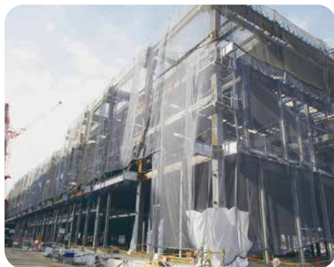
小平インベーションセンター新築工事